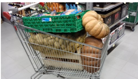
Dons de notre partenaire Bi1