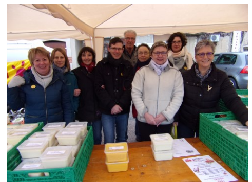
Certains bénévoles