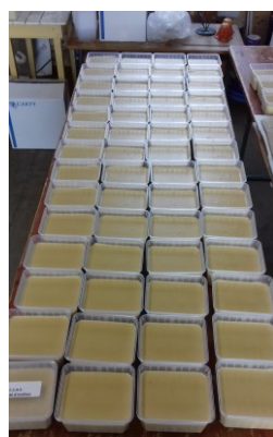
Quelques soupes ...