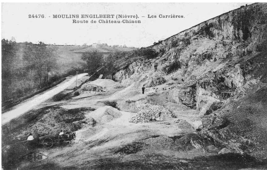
24476. - MOULINS ENGILBERT (Nièvre). - Les Carrières. Route de Château-Chinon