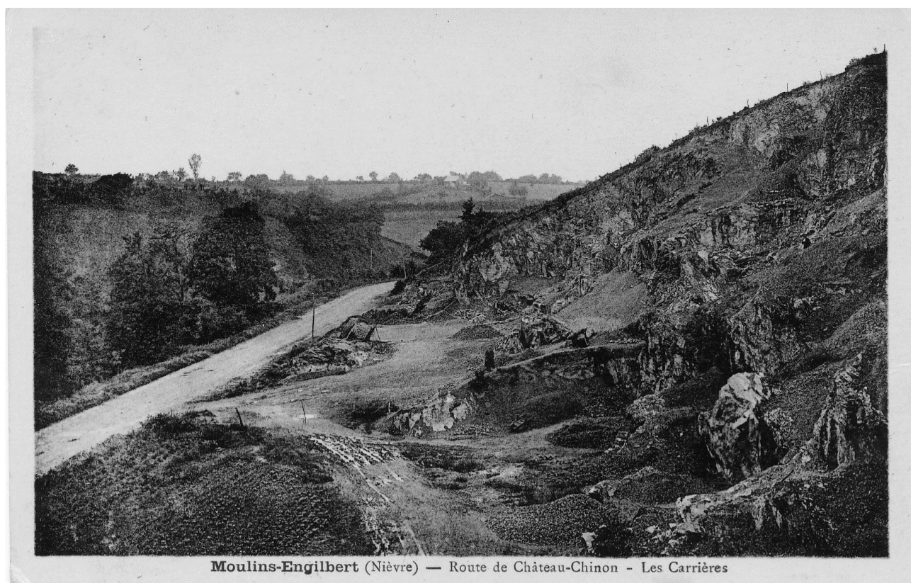
Moulins-Engilbert (Nièvre) — Route de Château-Chinon - Les Carrières

Triste fin pour une entreprise débutée le 7 février 1955.