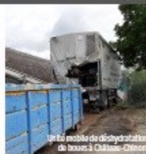
Unité mobile de déshydratation de boues à Château-Chinon

Les trente plus grosses stations d'épuration du département en dépolluant les eaux usées produisent des boues biologiques qui étaient jusqu'à présent valorisées sur des sols agricoles car riches en azote et en phosphore.